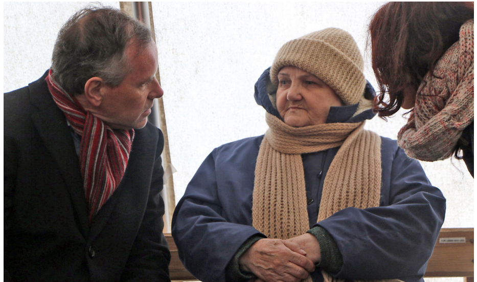
Й.В. пан Уле Т. Хорпестад, Посол Норвегії в Україні, спілкується з літньою жінкою у наметі первинної медичної допомоги на КПВВ Майорськ

Делегація відвідала Краматорськ, Слов'янськ, Святогірськ, Майорськ, Бахмут, Торецьк та Дружківку, щоб зустрітися з місцевими активістами та неурядовими організаціями, внутрішньо переміщеними особами (ВПО), людьми, які залишали свій дім на час гострої фази конфлікту, але потім повернулися, а також жителями «сірої зони». Остання група перетнула лінію розмежування спеціально, щоб поділитися із дипломатами та представниками міжнародних організацій своїми історіями, болем та страхами, але водночас надією та досвідом стійкості. Серед ВПО та місцевих жителів, які зустрілися з делегацією, були бенефіціари проектів грошової допомоги та підтримки samozайнятості й дрібного бізнесу, впроваджених МОМ за фінансування Європейського Союзу, Посольства Великої Британії в Україні та Бюро з питань народонаселення, біженців та міграції Державного департаменту США. Дипломати також зустрілися з членами ініціативних груп, які беруть участь у проекті МОМ із соціального згуртування. Зустрічі відбулись у бібліотеках, що перебувають у процесі ремонту чи вже були відремонтовані за фінансування Уряду Японії.