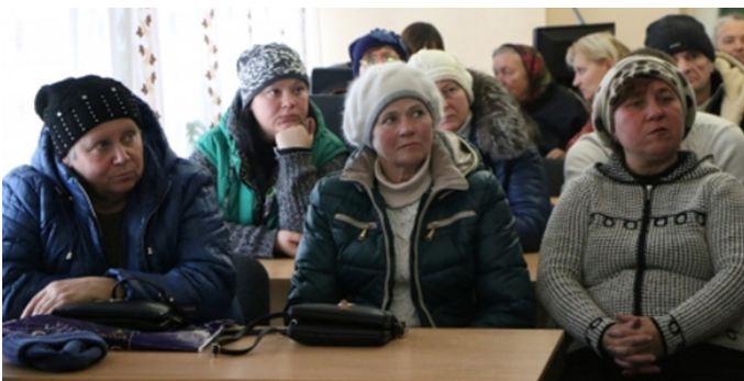
Зустріч із групою місцевих жителів, що повернулися, та мешканців "сірої зони" у Торецьку