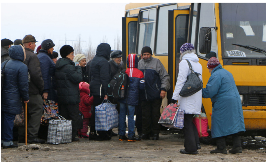
Люди, які переміщуються між контрольованою урядом та неконтрольованою територією сходу України, сідають в автобус на контрольному пункті (КППВ) Майорськ

Гуманітарні потреби людей, постраждалих внаслідок конфлікту в Україні, і тих, хто повертається на територію, невідконтрольній уряду, зростають. Багато громад залишаються відрізнаними від ринків, соціальних послуг, житла та можливостей працевлаштування. За даними останнього раунду Національної системи моніторингу – опитування щодо ситуації з внутрішньо переміщеними особами (ВПО) в Україні, проведеного МОМ за фінансування Європейського Союзу, кількість ВПО, які повертаються на невідконтрольну територію, зростає*. Через три з половиною роки конфлікту 16% респондентів, опитаних у вересні, заявили, що вони повернулися до ►