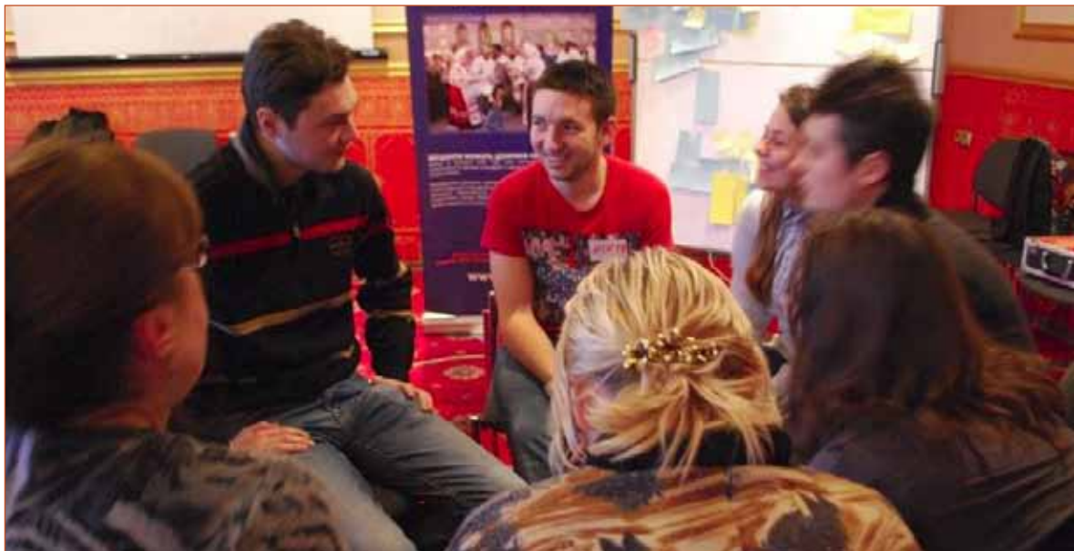
Жива бібліотека з слідчим, м. Київ, 29 січня 2015 року

При створенні ІР-ЖБ основна увага має приділятися підбору Книжок такого етнічного та соціального походження, які зазвичай стикаються з невірним розумінням, упередженим ставленням та стереотипами. У першу чергу слід залучати осіб, які вже мешкають у відповідному населеному пункті і можуть представляти свої етнічні або соціальні групи.