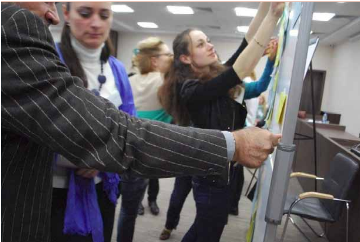
«Відкритий простір», Київ, 28 січня 2015 року