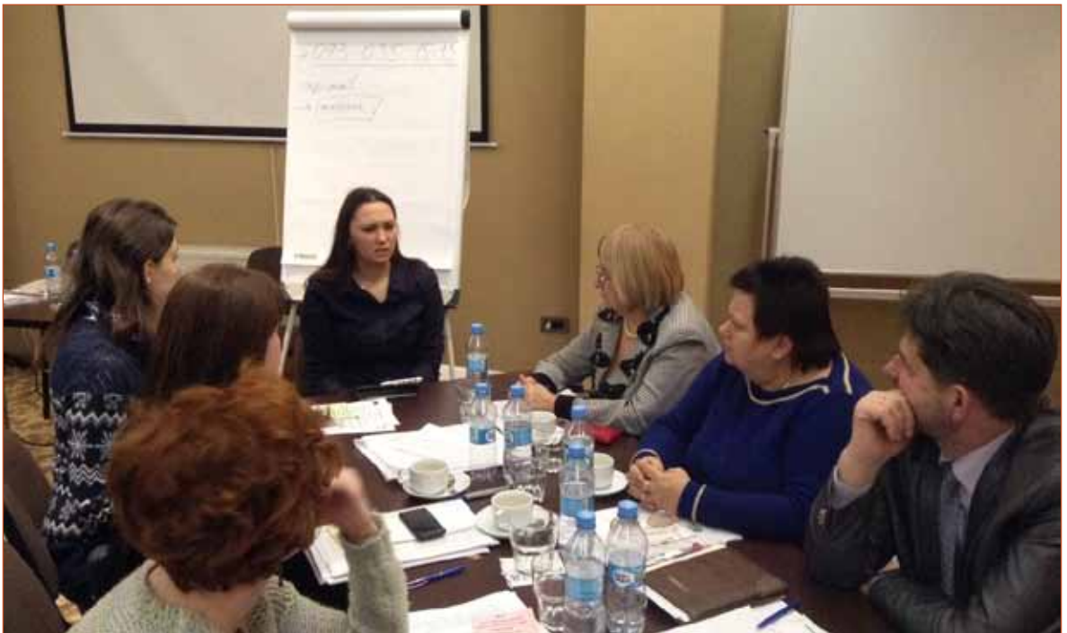
Жива бібліотека з слідчим, м. Одеса, 19 лютого 2015 року

Національні меншини, іноземні студенти, шукачі притулку, волонтери Корпусу миру, волонтери AIESEC, лідери громади, представники посольств, неурядових організацій (НУО) або міжнародних організацій, а також слідчі та оперуповноважені .