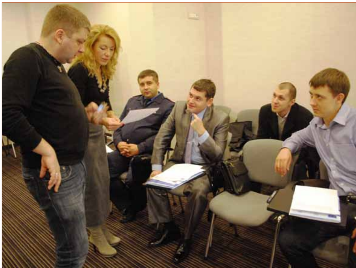
Обговорення прикладів злочинів в групах. Тренінг у м. Одеса, 10-11 листопада 2014 р.