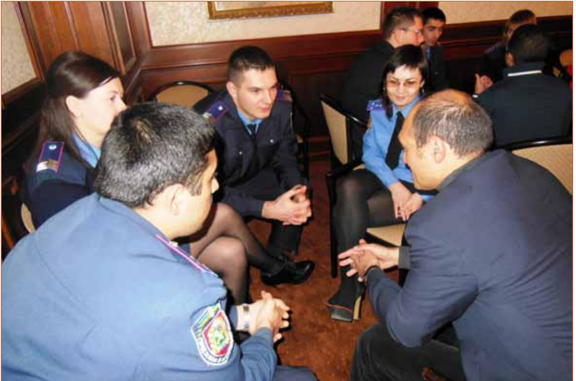
«Жива бібліотека» під час тренінгу в м. Харків, 17-18 листопада 2014 р.

Національні меншини, іноземні студенти, шукачі притулку, волонтери Корпусу миру, волонтери AIESEC, лідери громади, представники посольств, неурядових організацій (НУО) або міжнародних організацій.