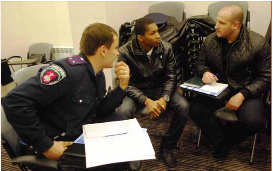
«Жива бібліотека» під час тренінгу в Одесі, 10-11 листопада 2014 р.

При створенні ІР-ЖБ основна увага має приділятися підбору Книжок такого етнічного та соціального походження, які зазвичай стикаються з невірним розумінням, упередженим ставленням та стереотипами. У першу чергу слід залучати осіб, які вже мешкають у відповідному населеному пункті і можуть представляти свої етнічні або соціальні групи.