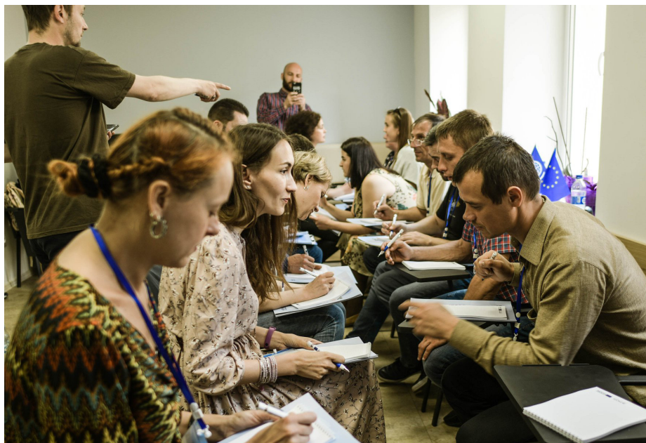
Ініціативні групи, до яких увійшли ветерани та інші активісти з громад, пройшли підготовку з управління ресурсами і розробили плани заходів соціального згуртування

Гранти до 400 євро на професійну освіту, перекваліфікацію або підвищення кваліфікації буде надано 400 ветеранам, що пройшли конкурсний відбір. Стільки ж ветеранів отримають гранти розміром до 1 000 євро на розвиток самозайнятості. Крістіан Щербаков — учасник проекту МОМ. Програміст за фахом,