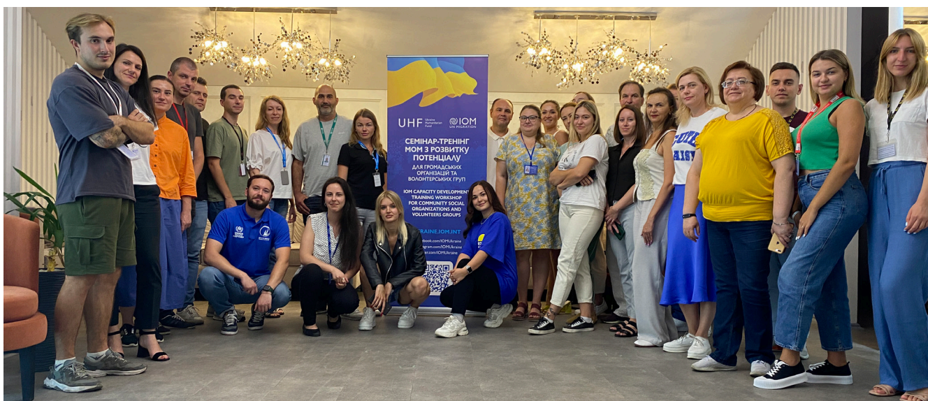
Соціальні організації громади беруть участь у тренінгу МОМ у Миколаєві, вересень 2023 року.

ТТ та тренінги з розбудови потенціалу стали цінним внеском у зусилля МОМ, спрямовані на підтримку відновлення засобів до існування та підвищення стійкості в Україні. Вони допомогли забезпечити співробітників МОМ та ОГС знаннями та навичками, необхідними для розробки та впровадження ефективних програм з відновлення засобів до існування та підтримки локалізації в Україні.