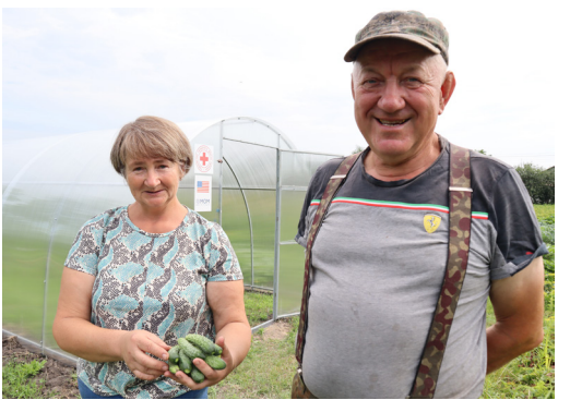
Мешканці села на Київщині поруч з теплицею, яку вони отримали завдяки гранту від МОМ.

МОМ провела тренінг для тренерів (ТТ) для своїх співробітників з основ забезпечення засобів до існування. Після тренінгу було проведено сім сесій з розбудови потенціалу для 175 учасників з неурядових організацій (НУО) та ак-