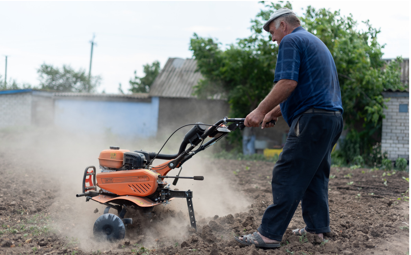
Фермер з Херсонської області використовує культиватор, який йому надала МОМ.